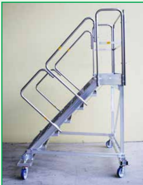
Tukan 7gr, 100x40, 4WD, Grigliato