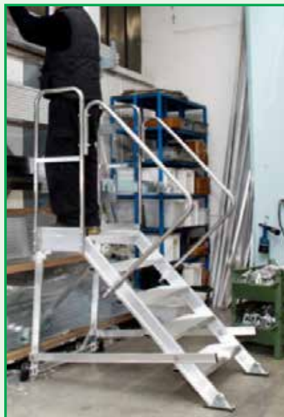
Tukan 5gr, 60x40, Sbarco Frontale