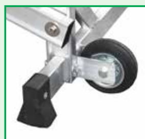
Sistema freno automatico