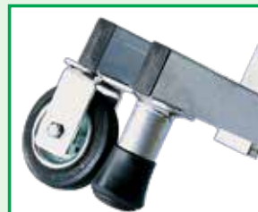
Sistema freno automatico