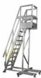
Salva spazio a sbalzo