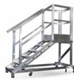
Salita extra comoda