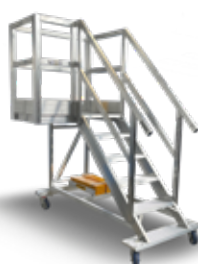
Piattaforma a sbalzo laterale