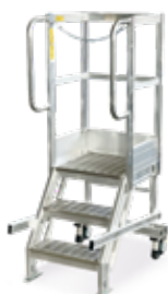
Gradini e piattaforma grigliati