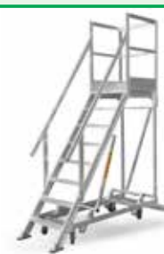
4WD con sistema SmartLock