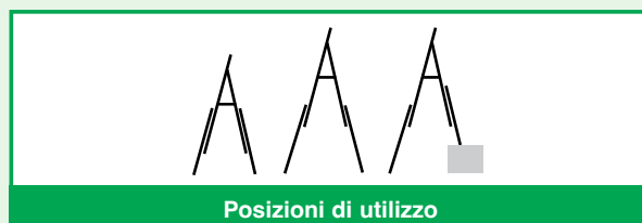
Posizioni di utilizzo