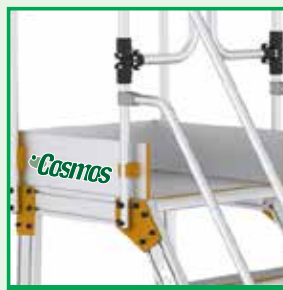
Piattaforma e fermapiedi