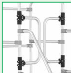
Cancelletto di sicurezza