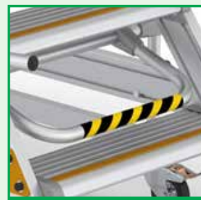
Segnale ruote in funzione