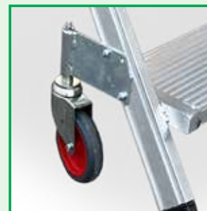
Ruote a molla

TUTTI GLI ACCESSORI OPTIONAL SONO A PAG.87