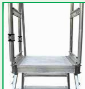
Piattaforma in alluminio