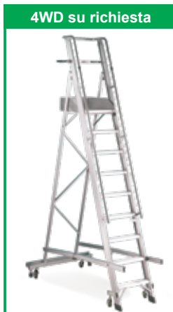
4WD su richiesta