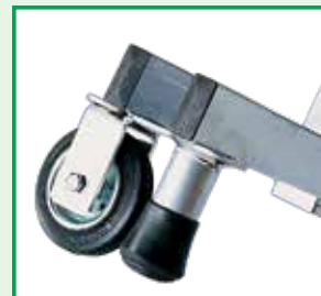
Sistema freno automatico