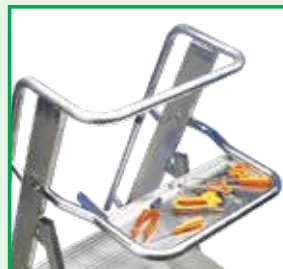
Pianetto (portata 10kg)