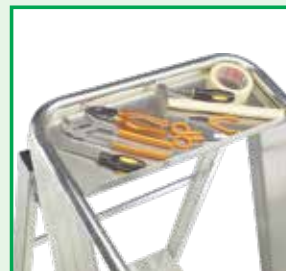
Pianetto (portata 10kg)